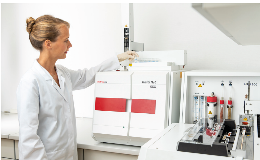
multi N/C duo